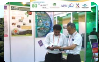
APN at the 23rd IUFRO World Congress 第23回国際林業研究機関連合(IUFRO)世界大会への参加

The APN relies heavily on the generosity and commitment of all its member countries and a broad range of institutions and partner organisations for financial and in-kind support.