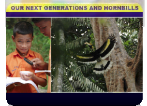
From Hornbill hunters to guardians サイチョウの密猟者が保護者へ