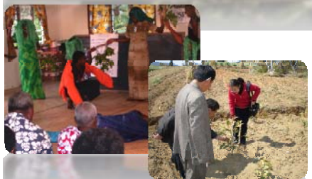
Raising community awareness of climate-related impacts on biodiversity loss 生物多様性、気候変動などの問題について地域コミュニティと学ぶ