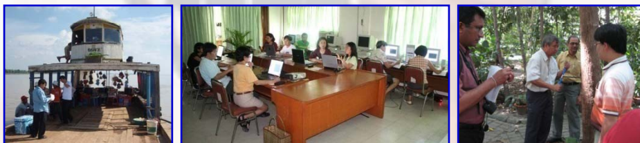
水質モニタリング